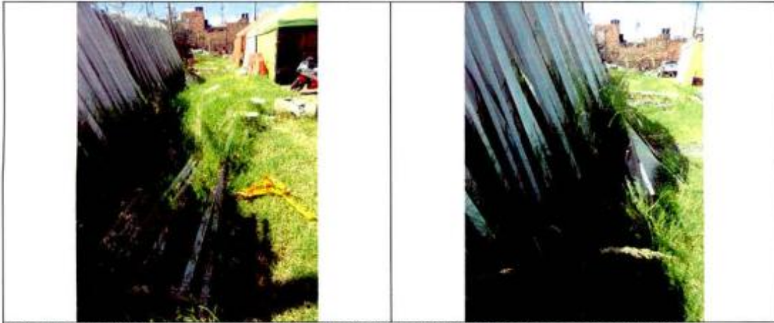
Registro fotográfico tomado en ejecución de la Visita Administrativa practicada el pasado 17 de febrero.

“Por un Control Fiscal Efectivo y Transparente”