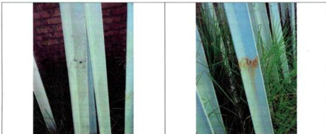
Postes para señales que se han completado con partes de otros pedestales retirados del espacio público y unidos con soldadura.

No obstante lo anterior, este Organismo de Control en adelantamiento de la Visita Fiscal practicada el pasado 17 de febrero, detectó que algunos de los pedestales o postes que fueron objeto de adecuación y pintura, en virtud del Contrato de Prestación de Servicios No. 2076 de 2013 no cumplen con la citada norma, ya que fueron completados u objeto de añadiduras con el uso de soldaduras de partes y/o piezas de otros soportes de señales retirados del espacio público, conforme lo ilustra el siguiente registro fotográfico: